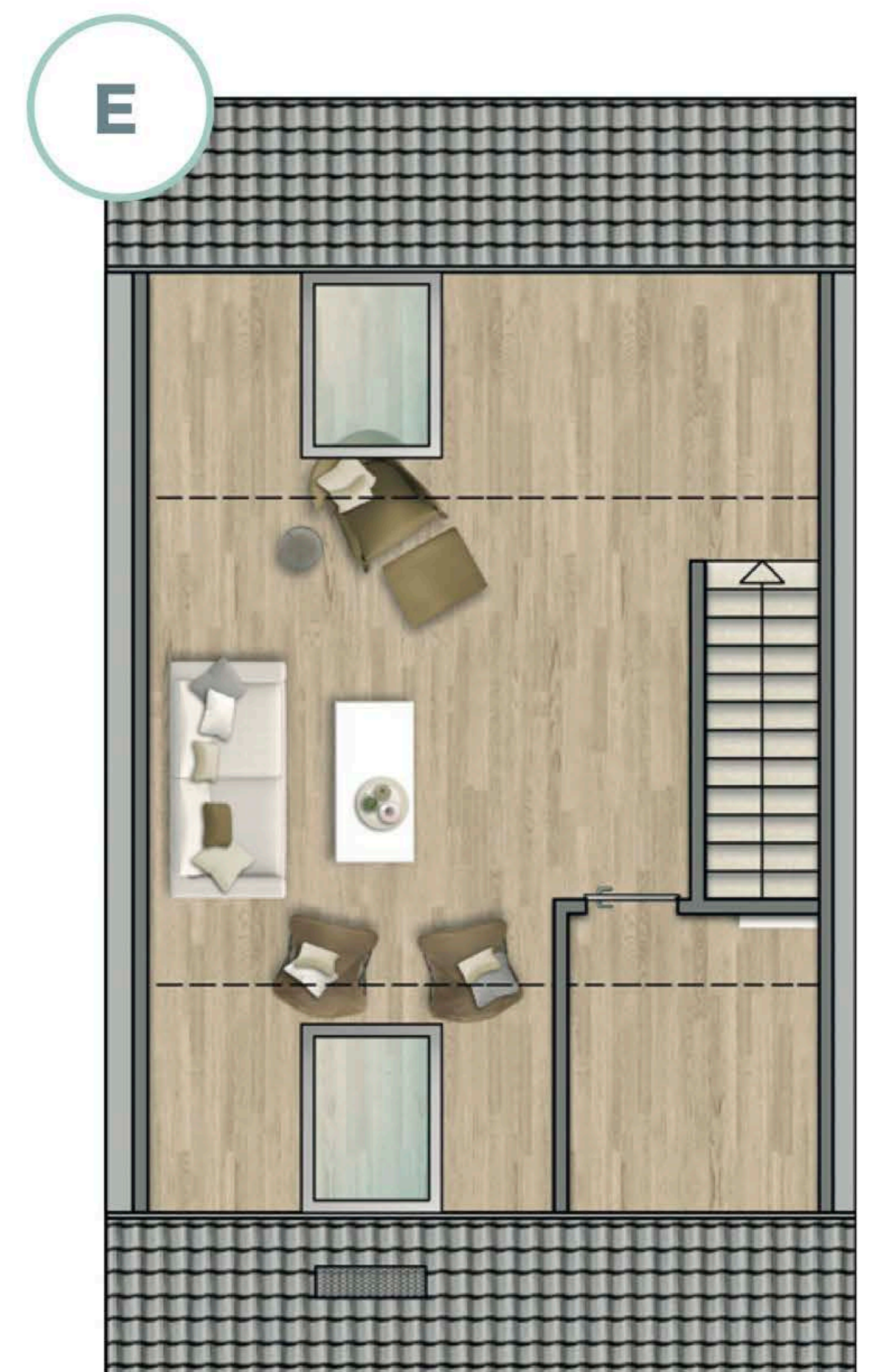
(E) mit Abstellraum