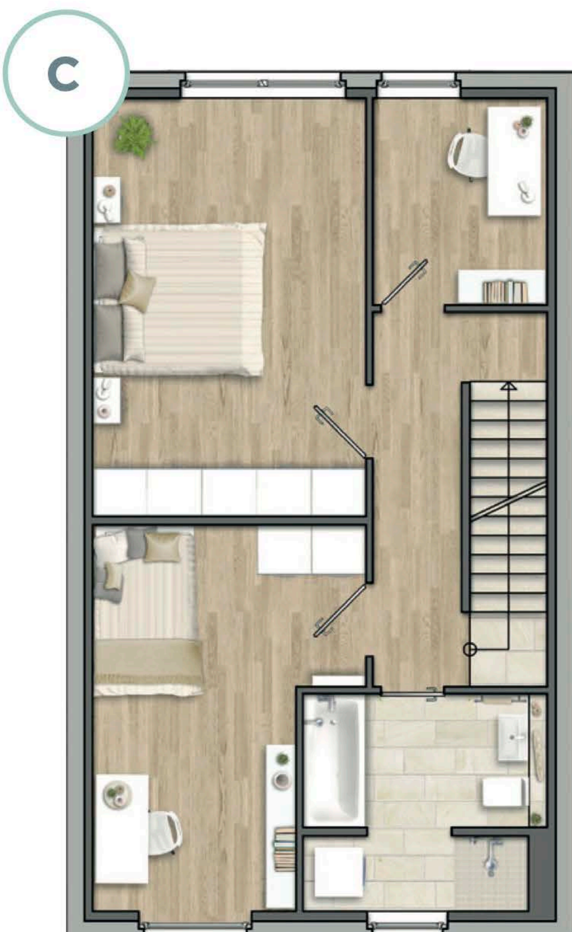
(C) weiterer Raum durch Trennwand