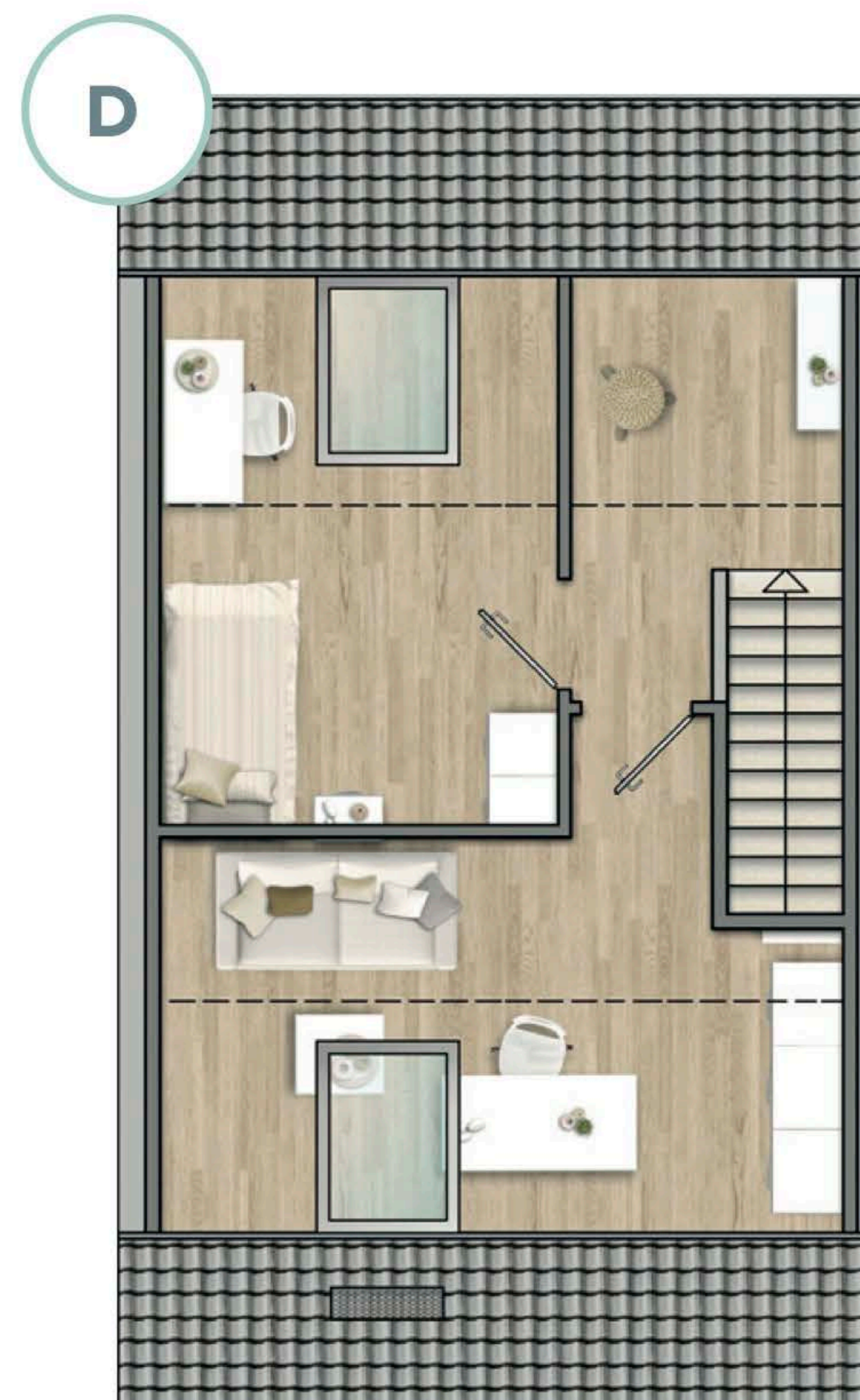
(D) weiterer Raum durch Trennwand